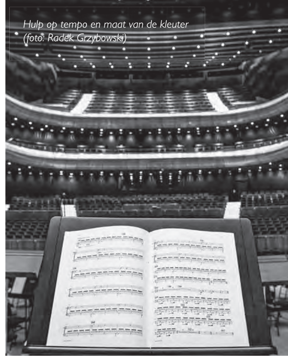
Hulp op tempo en maat van de kleuter